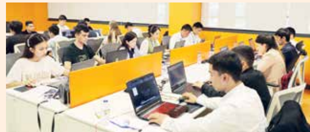
Shu kunlarda "Yangi avlod muhandislari – yangi davr texnologiyalari" shiori ostida "Kelajak muhandislari" xalqaro festivali bo'lib o'tmoqda.

Oliy ta'lim, fan va innovatsiyalar vazirligi tomonidan uyushtirilgan ushbu festival kelajakni bugundan yaratadigan ijodkor yoshlar uchun innovatsion platforma bo'lib xizmat qilishi bilan ahamiyatlidir.