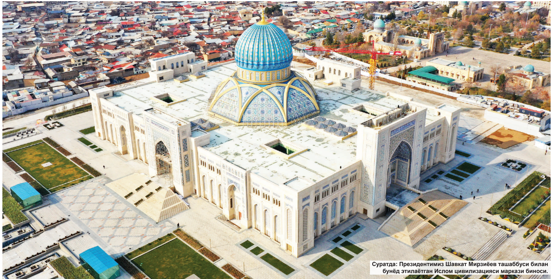
Суратда: Президентимиз Шавкат Мирзиёев ташаббуси билан бунёд этилаётган Ислам цивилизацияси маркази биноси.

Тараққиётимизнинг янги даврида инсонларнинг эътиқод эркинлигини таъминлаш халқимизни маънан юксалтириш ва илм-маърифатли авлодни тарбиялашга хизмат қилмоқда. Айниқса, мўмин-муслмонларимиз ибодатларини эмин-эркин адо этишлари учун барча шароитлар яратилди, мамлакатимиз бўйлаб юз-