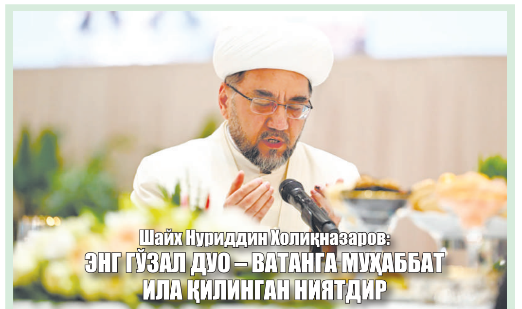
Шайх Нуриддин Холиқназаров: ЭНГ ГЎЗАЛ ДУО — ВАТАНГА МУҲАББАТ ИЛА ҚИЛИНГАН НИЯТДИР

Манба: «Vatan» журналининг 2025 йилдаги 1-сон