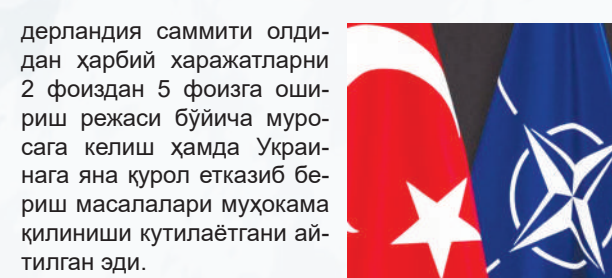
Оламгир ОТАЁРОВ тайёрлади

Учрашувга ташкилотнинг янги бош котиби Марк Рютте раислик қилади. Ҳозирча учрашув кун тартибидagi масалалар юзасидан аниқ маълумот берилмаган бўлса-да, Брюсселдаги 3-4 апрель йиғилишида июлда бўлиб ўтадиган Нидерландия саммити олдиндан ҳарбий харажатларни 2 фоиздан 5 фоизга ошириш режаси бўйича Украинага яна қурол етказиб бериш масалалари муҳокама қилиниши кутилаётгани айтилган эди.