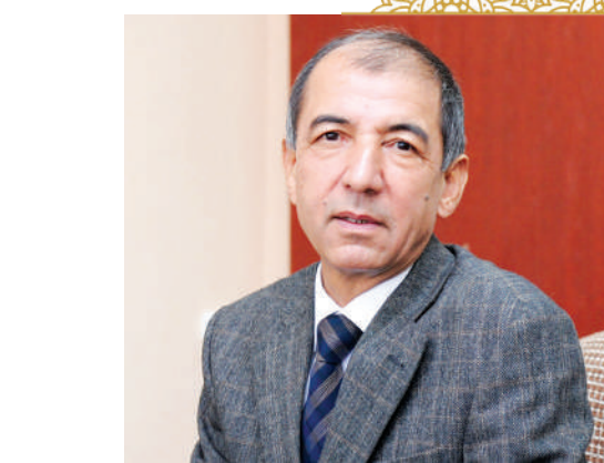
Сирожиддин САЙИД, Ўзбекистон халқ шоири

Бу хушхабар алқаб давру замонни, Овозаси тутди рўйи жаҳонни.