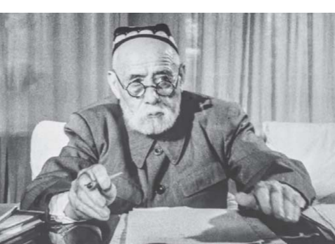
Устод Айнӣ дар боби «Таърихи Ёротеппа ва таъмири Самарқанд» ниғоси тааст: «Дар аҳди амир Шоҳмурод дар Ёротеппа аз авлоди қаллика Худоевӣ бинни Фозилӣ бил-истиқлол ҳукумат дошт, Хучанд, Хавос, Зомин ва Диззах аз қаламрави ӯ ба шумор меафта. Амир Шоҳмурод то зинда будани Худоевӣ мазкур ба мулки ӯ тааруз накард.

Хамин тавр, таъкиди кардаанд муаллифони «История Самарқанда», – солҳои 50-уми асри XVIII аз Хисор ба Самарқанд чандин ҳазор хонавода кӯчонида шуд. Устод Айнӣ ин амали Муҳаммад Раҳимҷонро тавсифи накардааст, балки ҳақиқатинона тавсифи намуздааст. Ин амир барои андак гуноҳи ҷазои қуштан мефармудааст. Бинобар ин, қасони аз Хисор ба Самарқанд кӯчондашуда ҷуръати бозгашт ба зодгоҳи худ накардаанд.