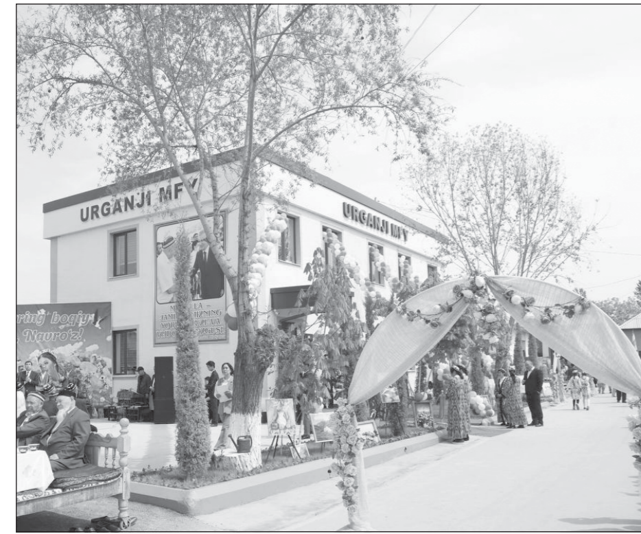
Дар ноҳияи Бувайда барои ҷамоати шаҳрвандони маҳаллаи «Урганҷи» бинои нави замонавӣ ба истифода супурда шуд.