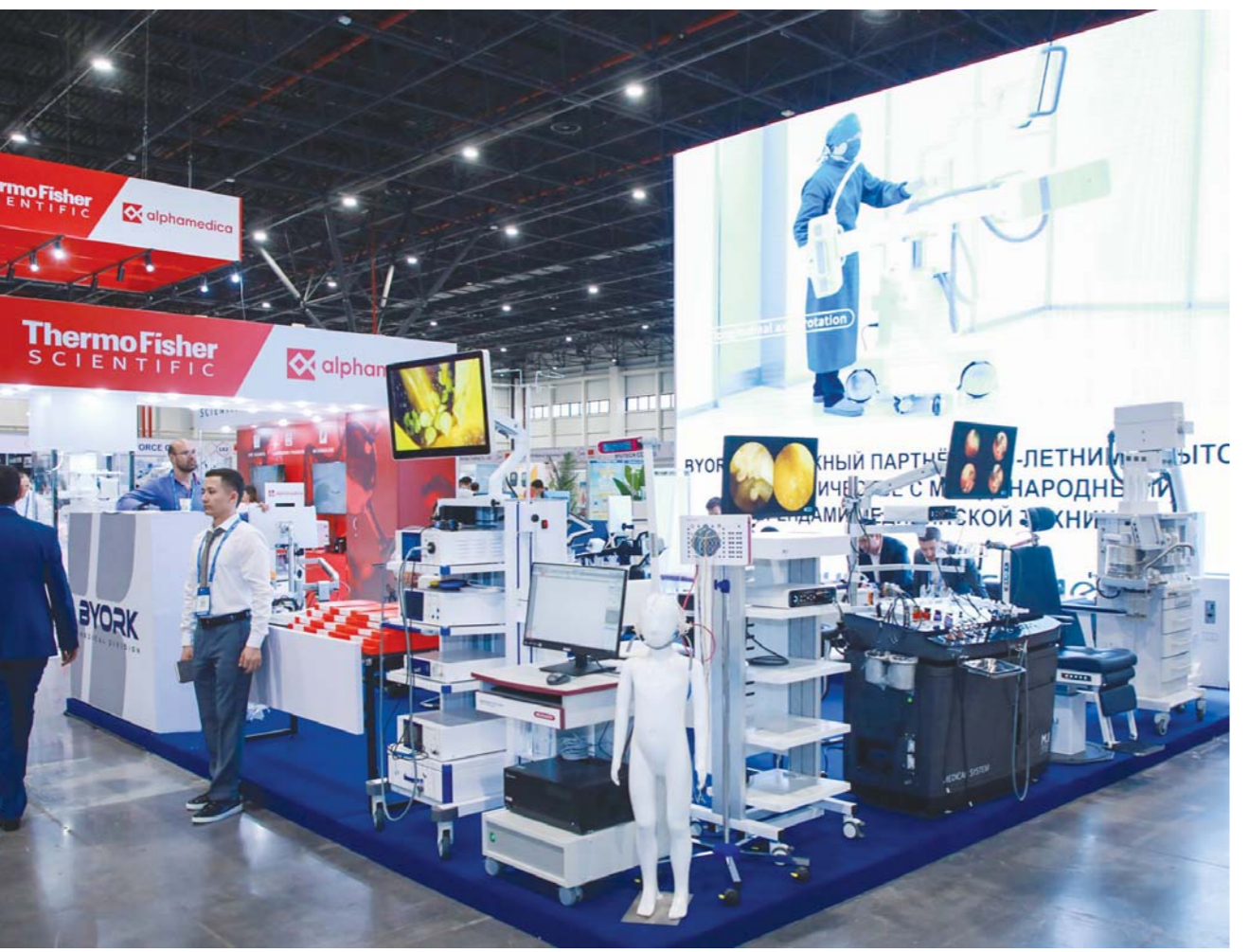
Дар маркази намоишгоҳи байналхалқии «CAE Uzbekistan» чорабиниҳои намоиши байналхалқии Тошканд-29, «Ҳифзи тандурусти – ТИНЕ 2025» баргузор шуд. Намоишгоҳи мазкур чорабиниҳои бузурги байналхалқӣ дар бахши технологияи пешқадам, асбобу ускунаҳои ташхисгузории дақиқ, таҷҳизоти муосири тиббӣ дар соҳаи тиб маҳсус мешавад. Намоишгоҳ аз 23 мамлакат беш аз 400 ширкат ва брендҳо муттаҳид сохт. Ширкатҳои пешбари ИМА, Олмон, Туркия, Ҷопон, Ҷумҳурии Корея, Чин, Италия, Қазоқистон, Русия, Ҳиндустон аз он ҷумлаанд. Кишвари Чин (116 ширкат), Корея (16 ширкат), Туркия (8 ширкат), Олмон (12 ширкат) ғафол буданд. Теъдоди ширкатҳои маҳаллӣ низ рӯ ба афзоиш ниҳодааст. Иштироки онҳо имсол 24 фоизро ташкил дод. Дар акс: лавҳае аз намоишгоҳ.

Ба мақсади қонеъ гардондани талаботи рӯзфазуни аҳолии ба захираҳои энергетикаӣ ҳар сол лоиҳаҳои зиёд амалӣ мешаванд. Дар натиҷаи ин талаботи дар панҷ соли охир ҳаҷми истеҳсоли неруи барқ 30 фоиз афзуд, ба 81,5 миллиард киловатт-соат расид. Мувофиқи ҳисоби китоб то соли 2035 истеъмоли неруи барқ дар кишвар 121 миллиард киловатт-соатро ташкил хоҳад дод. Ба ин муносибат ҳанӯз аз имрӯз оид ба рушди тамоми самтҳои энергетикаи чораҳо андешида мешаванд. То соли 2030 то ба 54 фоиз расондани ҳиссаи энергетикаи «сабз» дар ҳаҷми умумии тавлид ба нақша гирифта шудааст. Самтҳои умедбахши ин соҳа гидроэнергетика ва энергетикаи атомӣ маҳсус меёбад. Аз ҷумла дар солҳои 2025-2026 бунёди 2 983 неругоҳи хурди барқи обӣ бо иқтидори умумии 167 мегаватт ба нақша гирифта шудааст. Ин иншоот имкон медиҳад ҳар сол 500 миллион киловатт-соат неруи барқи аз ҷиҳати экологӣ тоза истеҳсол ва 151 миллион метри мукааб гази табиӣ сарфа карда шаванд. Дар марҳилаи сохтмон 1200 нафар ва пас аз ба истифода додани иншоот