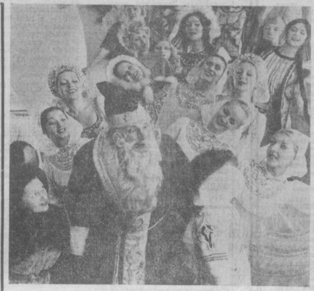
В Хабаровске зрители познакомилась с первой программой нового профессионального творческого коллектива — государственного Дальневосточного песенно-танцевального ансамбля.

Широкий выбор товаров в прокатном пункте издавна открывался в махаллах имени Айбека. Это тридцатое по счету предприятие «Ташгорпродтранспорта». В пунктах этого объединения можно взять на прокат различные изделия повседневного обихода, радиоприемники, телевизоры, холодильники и многое другое.