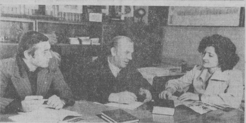
ХРОНИКА ИДЕОЛОГИЧЕСКОЙ РАБОТЫ