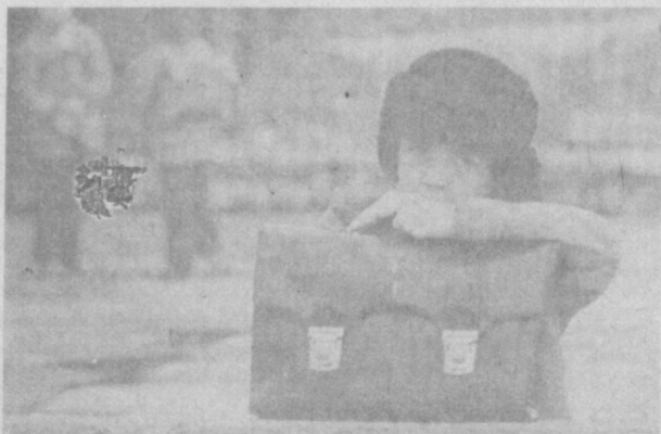
После урока...