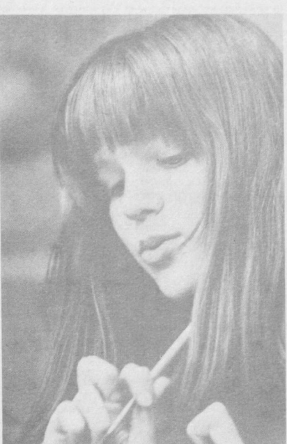
Размышление над книгой.

Уютные комнаты, цветы, столы с чайной посудой, мягкие кресла — все располагает к дружеской беседе. Здесь размещен консультативный центр психологической помощи семье, организованный Институтом общей и педагогической психологии Академии педагогических наук. Каждый второй посетитель центра — родитель, не удовлетворенный отношениями с собственными детьми. «Мы с сыном чужие люди. Он все время молчит, никогда не рассказывает о своих делах...» «Дочь плохо учится, грубит». «Всю жизнь отдала сыну. Только ради него сохранили семью. Он все время проводит вне дома, с нами холоден». Сотни и сотни подобных историй достоверно рассказаны в этих стенах. Почему так происходит? Специалисты считают, что ныне