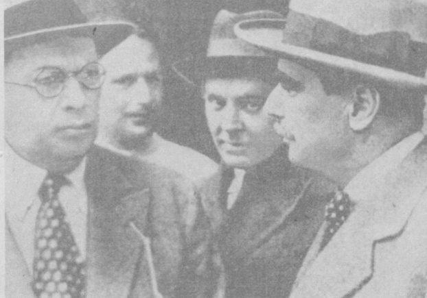
Герберта Уэллса во время одной из встреч. Встретились два больших художника слова, являющихся настольными книжками для миллионов и сегодня и миллионов читателей.

Даже Герберту Уэллсу, величайшему среди великих писателей фантастов, не хватало в свое время фантазии оценить, сколь реалистично фантастическое будущее отстало в недавнем прошлом царской России.