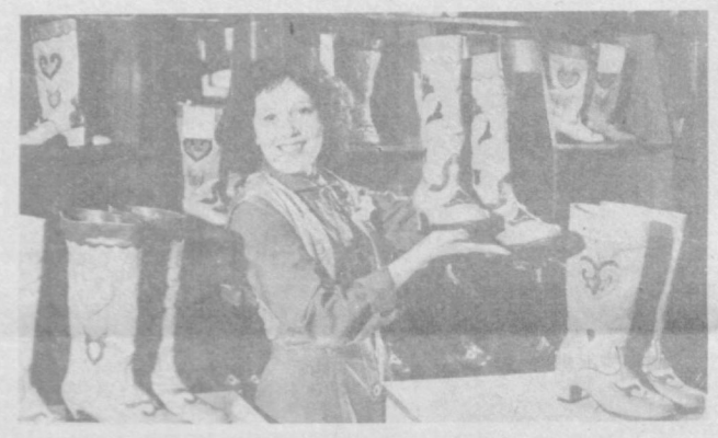
Через столетия дошли до нас творения гончаров, ювелиров, ковачников Татарии. Нынешние мастера достойно продолжают их традиции. НА СНИМКЕ: красочно расшитые национальные сапожки — ичиги выпускают в Арси и Казани. Они экспонировались на Международной ярмарке в Лейпциге и были удостоены золотой медали.

Итак, дорогие читатели, вас ждут увлекательные путешествия по братским странам социализма: новые города, встречи с интересными людьми, красивые виды природы.