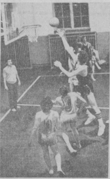
Успешно выступает в первенстве страны по баскетболу среди мужских команд первой лиги ташкентский «Университет». Команда находится сейчас в числе лидеров.