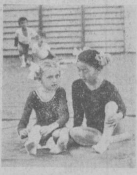
ЮНЫЕ ГИМНАСТЫ.