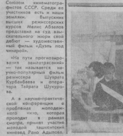
В Ташкенте возматилась бригада мастеров прикладного искусства Узбекистана, которая завершила создание уникального росписи в новом гостиничном комплексе на Зеленопольской улице в Москве. Наш корреспондент встретился с руководителем бригады и ее членами.