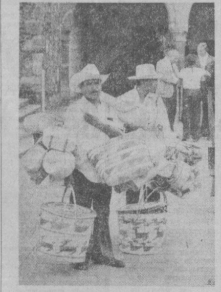
Мексика. Столица государства — Мехико — один из древнейших городов на земле. В окрестности на ул. Симке. В окрестности на ул. Симке.

Первый участок метрополитена протяженностью 7 км займет новый жилой квартал «Людли» с площадью Ленина в центре города. На строительстве трассы будут использованы открытый метод прокладки.