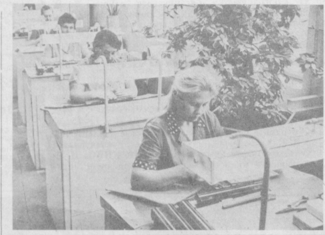
В иглонаборной мастерской текстильного комбината производится смена вышедших из строя игл...