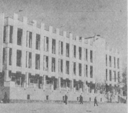
Готовясь к 2000-летию Ташкента, строители столицы воздвигли немало зданий современных архитектурных форм. Недавно в академгородке вступила в строй новая библиотека Академии наук Узбекской ССР. Построил ее коллектив 19-го управления 4-го треста Главташсавстр.