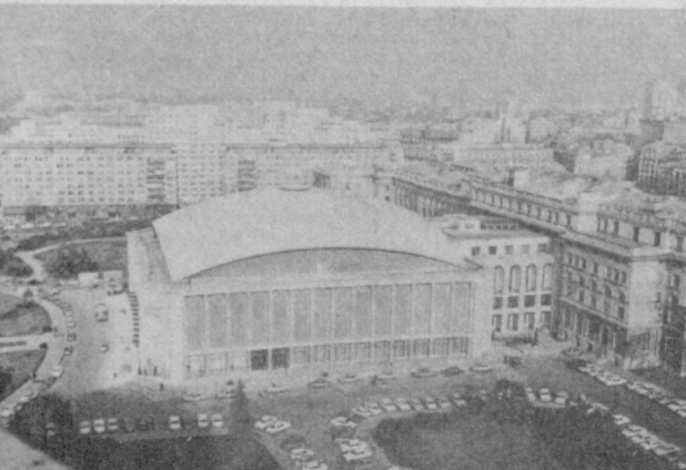
СРР. Дворец Социалистической Республики Румулин в Бухаре.

Победителям представляются 5 главных призов — бесплатная путевка в одну из социалистических стран. В конкурсе приняли участие более тысячи жителей Ташкента, Ташкентской области, а также жители других городов и сел республики.