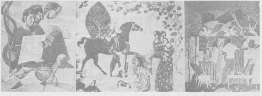
В мастерских художников

Сердце Черпакова начало стучать. Он глянул на часы: стрелки перевалили на рабочее время. — Бабушка, — сказал