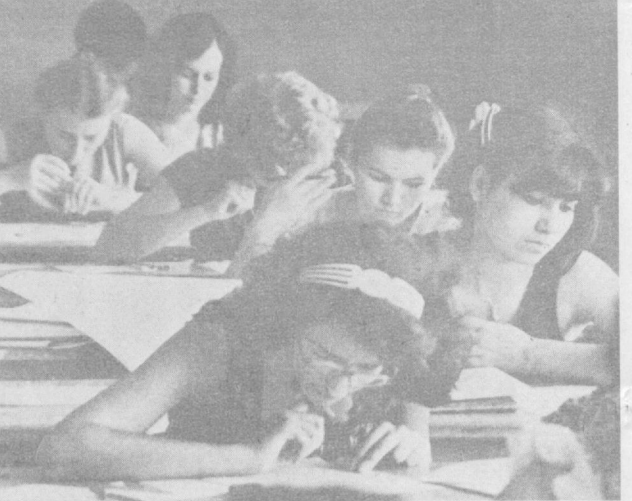
Сессия: время волнений и радостей...

Сегодняшняя подборка «Комсомолец Ташкента» посвящена делам и заботам студенчества города, учащихся техникумов и училищ, в ней рассказывается о том, как они своей учебой, трудовой деятельностью содействуют претворению в жизнь решений партии.