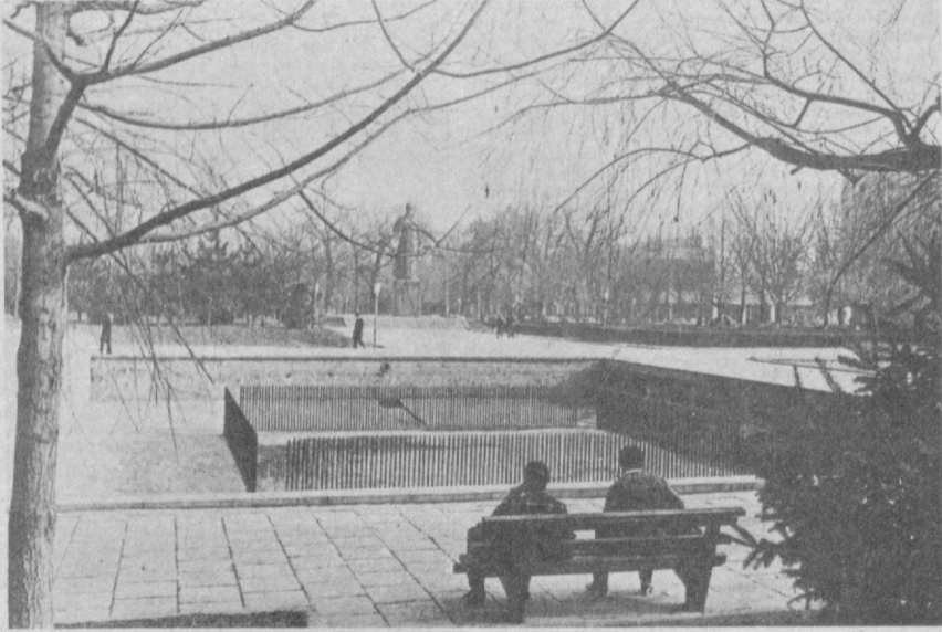
НА СНИМКАХ: Ташкент сегодня.