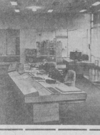
Объединенное диспетчерское управление энергосистемами Средней Азии. Из этого центра, оснащенного современной вычислительной техникой и автоматикой, осуществляется управление энергоресурсами региона. Благодаря умелому диспетчерскому управлению достигается наиболее рациональная и оптимальная подача электрической энергии на объекты народного хозяйства Узбекистана, Таджикистана, Киргизии, Туркмении, Южного Казахстана.