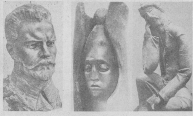
О. АЛУХТИН. НА СНИМКАХ: из экспонатов выставки.

Голова, окаймленная чалмой, пристальный взгляд человека, которого открыта истина, — таков портрет Авиенны, которого изваял Иван Клепичев.