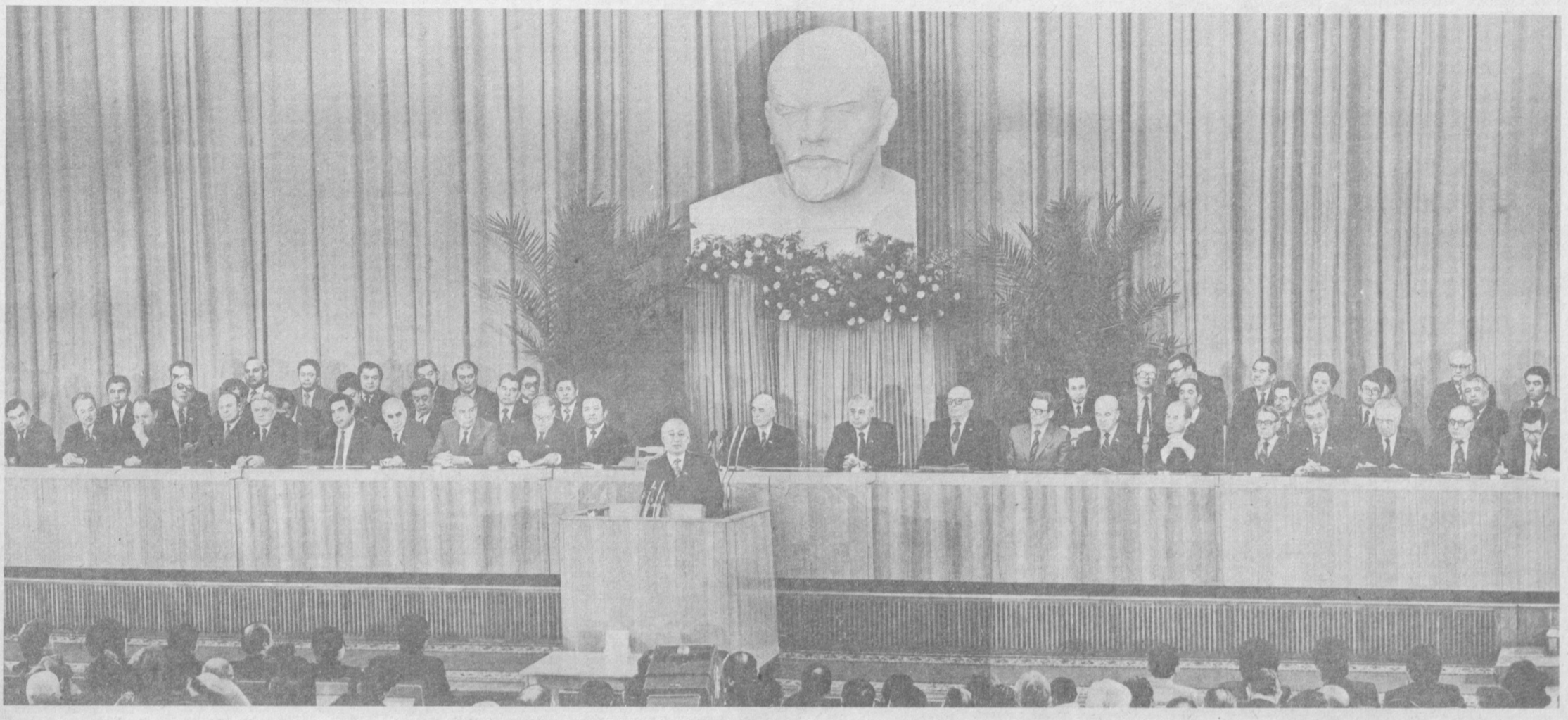
ТАШКЕНТ, 16 февраля. Открытие научно-теоретической конференции «Братское сотрудничество народов СССР на этапе зрелого социализма».

Сотни различных наименований кабелей и проводов выпускается в производственном объединении «Средкабель». И нет в стране такой республики или области, где бы в народном хозяйстве, быту не применялись эти изделия. Высоко оценивают изделия ташкентских кабельщиков и за рубежом — ныне в 24 страны мира идет продукция этого предприятия. Первыми в этом году каротажные кабели различных сечений получили хозяйства Венгрии, ГДР, Чехословакии.