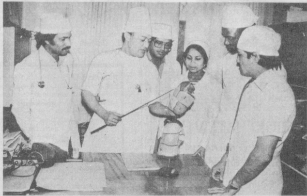
Мы — патриоты-интернационалисты

— Советская военная доктрина исходит из того, что решающее значение имеет единство материальных и духовных факторов в войне. Коренные качественные изменения, произошедшие в техническом оснащении войск,