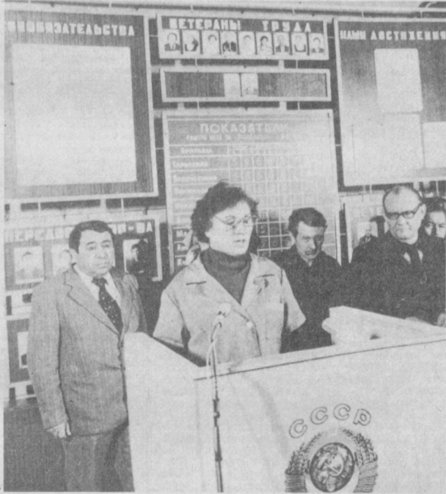
23 ФЕВРАЛЯ. Митинг на тепловозо-ремонтном заводе имени Октябрьской революции.

Кроме этого, часть рабочих займется работами по благоустройству территории, цехов и жилого массива. Будет высажено свыше тысячи штук зеленых насаждений. Все заработанные средства будут перечислены в фонд пятнадцатой пятилетки.