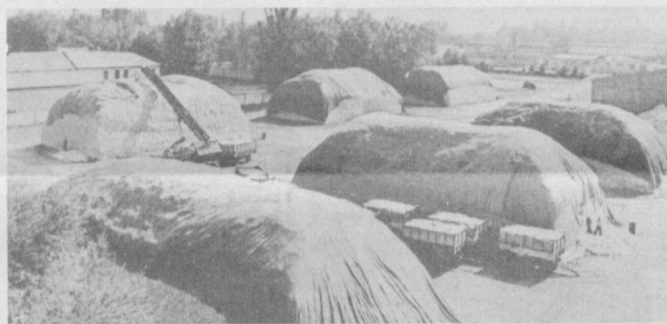
Особое внимание они рекомендуют уделить организации межхозяйственных предприятий по доращиванию и откорму скота, в которых среднесуточные привесы почти на одну треть больше, затраты кормов вдвое, труда — втрое меньше, чем в хозяйствах-пайщиках, а себестоимость ниже. Для улучшения породы скота, поставляемого на доращивание и откорм, ученые предлагают в хозяйствах — пайщиках шире проводить племенную работу по повышению мясной продуктивности молодых телят, комплексной застройки городов и населенных пунктов, улучшения качества градостроительства и архитектуры. Лучше учитывать интересы промышленных предприятий при распределении и территориальном размещении жилья, своевременно выделять жилую площадь в домах, построенных за счет их средств по долевым участию.

Внимательно вглядываясь Милый в карту Голодной степи. О чем задумался он! Уже тогда вождь гениально предвидел, как преобразится этот пустынный край, как благодаря великим свершениям социализма Голодная степь станет щедрой и плодородной. Сейчас это уже история, когда на эту землю пришли первооткрыватели и