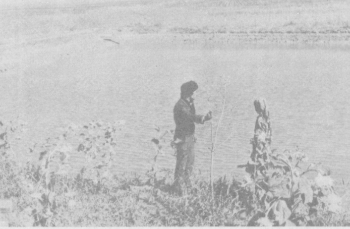
3. КОГДА ЗАБОТА ОБЩАЯ

Л. ГУРО, корреспондент прес-центра Минводхоза УзССР.