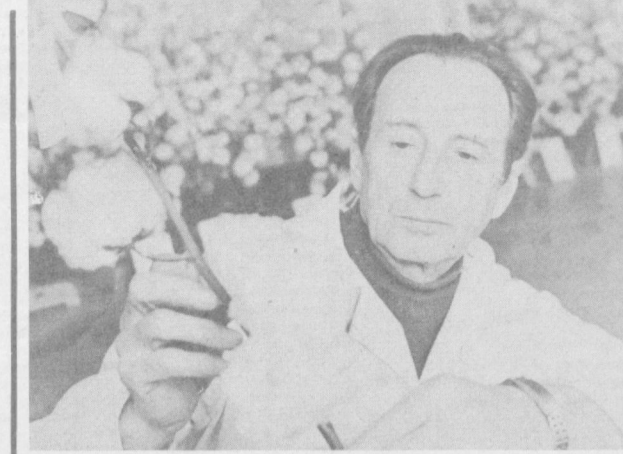
3. КОГДА ЗАБОТА ОБЩАЯ

Между творческими бригадами широко развернулось соревнование на лучшее обслуживание жителей села. Оно помогает значительно поднять уровень нашей работы.