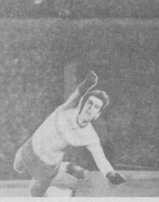
1/16 ФИНАЛА РОЗЫГРЫША КУБКА СССР