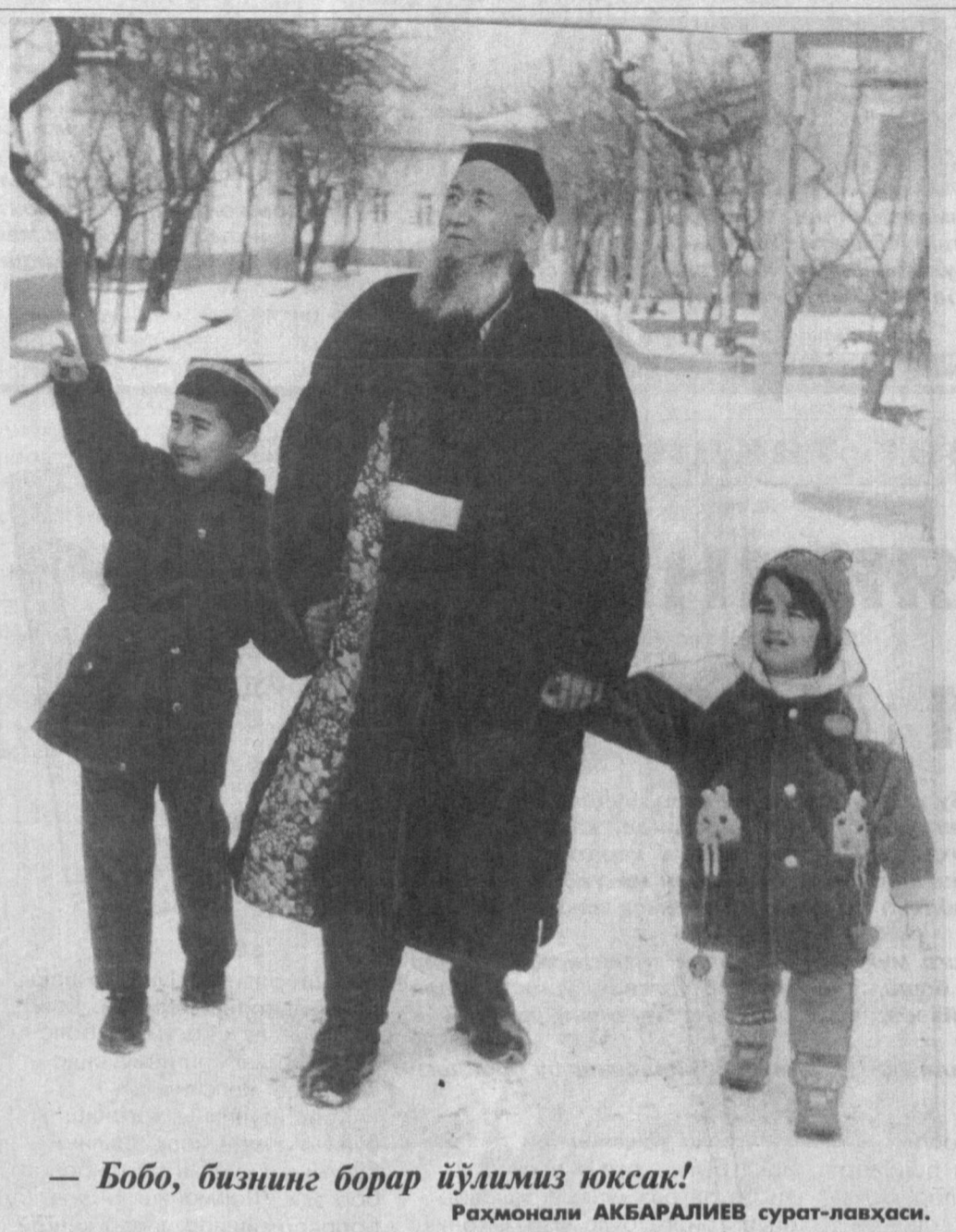
— Бобо, бизнинг борар йўлимиз юксак!