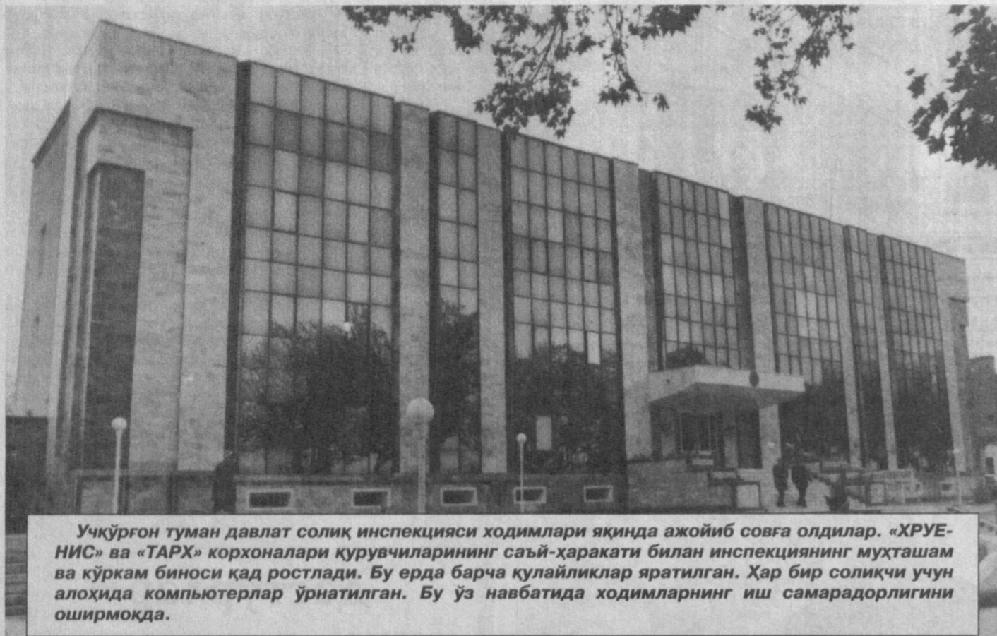
Учқўрғон туман давлат солиқ инспекцияси ходимлари яқинда ажойиб совға олдилар. «ХРУЕ-НИС» ва «ТАРХ» корхоналари қурувчиларининг сазой-ҳаракати билан инспекциянинг муҳташам ва кўркам биноси қад ростлади. Бу ерда барча қулайликлар яратилган. Ҳар бир солиқчи учун алоҳида компьютерлар ўрнатилган. Бу ўз навбатида ходимларнинг иш самардорлигини оширмақда.