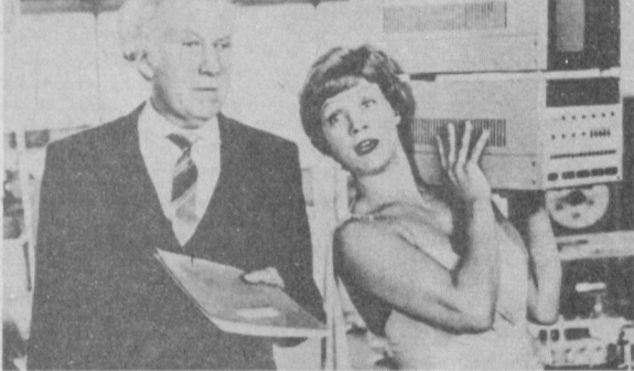
Производство киностудии «Мосфильм».

Отталкиваясь от факта утраченного лидерства мужчин в современном обществе, от изменившегося характера современной семьи и семейных отношений, фильм высмеивает нелепые стороны этих явлений.