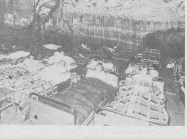
В ПНР широко известна шахта «Величка» под Крановом, эксплуатируемая с 1251 года. Она занесена в разряд уникальных памятников мировой культуры. Если раньше здесь добывали только соль, то ныне шахта служит дополнительно еще музеем и санаторием для больных астмой.

«Агромет» в Простеве уже несколько лет несет почетное звание предприятия чехословацко-советской дружбы. Этого отличия коллектив удостоился за качественное и своевременное выполнение советских заказов, за активное развитие связей с советскими партнерами.