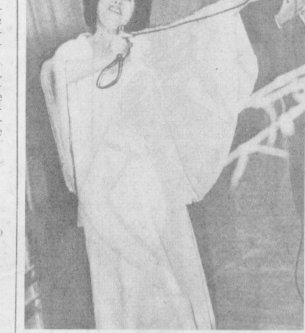
Гости нашей столицы

Сегодня мы заканчиваем серию материалов, посвященных древнейшей истории города. Многолетние археологические работы, проведенные на территории Ташкента, позволили ученым сделать вывод, что возраст столицы республики исчисляется в 2000 лет.