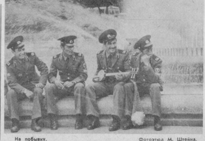
На побывку.

Недавно японская ассоциация автомобильных промышленников, например, объявила об осу-