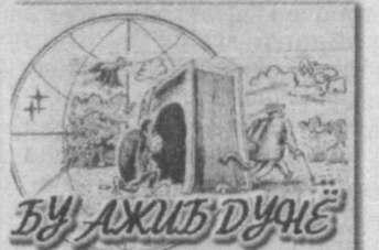
Бу ақиб дуяе