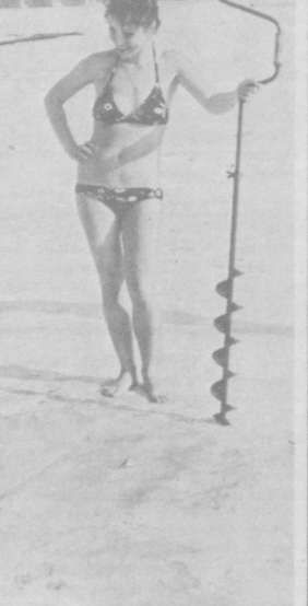
— На руслоп на кляю. (Ярославль).

«Царем дней», «праздником праздников» называли в старину Пасху. Этот главный христианский праздник в память воскресения Иисуса Христа пришел на Русь после крещения, в конце X века. Он отмечается в следующие за весенним равноденствием и полнолунием «светлые» воскресенья.