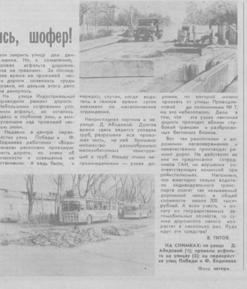
НА СНИМКАХ: [1] — провал асфальта на улице [2]; на перекрестке улиц Победы и Ф. Ходжаева.

Недавно в центре перекрестка улиц Победы и Ф. Ходжаева работники «Водоканала» раскопали проезжую часть дороги, но знаки об опасности и освещении не установили. А ведь были, и нередко, случаи, когда водители в темное время суток не видели на металлических ограждениях.