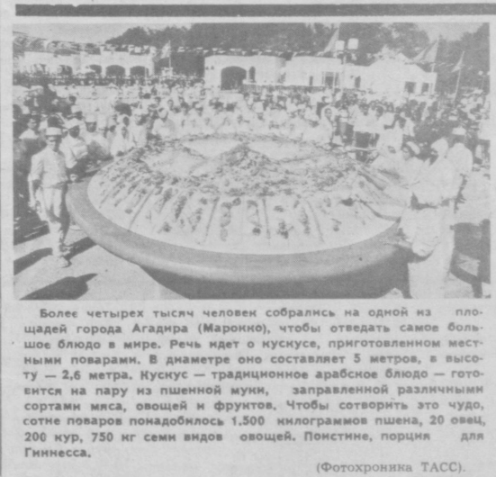
Более четырех тысяч человек собрались на одной из площадей города Агадара (Марокко), чтобы отведать самое большое блюдо в мире. Речь идет о куске, приготовленном местными поварами. В диаметре оно составляет 5 метров, в высоту — 2,6 метра. Кусок — традиционное арабское блюдо — готовится на пару из пшеничной муки, запавленной различными сортами мяса, овощей и фруктов. Чтобы сотворить это чудо, 200 повара понадобилось 1.500 килограммов пшена, 20 овец, 200 кур, 750 кг семи видов овощей. Помстине, порция для Гиннеса.