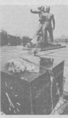
Кто восстанавливал наш город. И потому, видимо, в народе укоренились такие названия, как украинский, российский, ленинградский, белорусский кварталы.

1966 год. 5 часов 23 минуты. 25 лет назад в этот утрений, предвсвещенный час Ташкент постигло стихийное бедствие — страшное разрушительное землетрясение. Ущерб, нанесенный им столице республики, был огромен. Но сильнее стихии оказались сами ташкентцы: им помогли посланные братских республик, приехавшие на его восстановление. В Музее дружбы народов экспозиция о ташкентском землетрясении не так уж велика. Но странное дело, рассматривая фотографии, знакомясь с документами, убеждаешься, что каждый из экспонатов — уже история. Вот сейсмограф, зарегистрировавший первый толчок, здесь же статьи республиканских и городских газет, рассказывающие о том, что же все-таки произошло под Ташкентом. Следующие документы свидетельствуют: с нашим городом — вся страна. Формируются строительные бригады. Военные строители «возводят» палаточные городки.