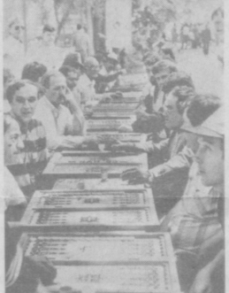
По инициативе Кировского и Куйбышевского райспорткомитетов и при участии хозяйственного объединения «Физкультура и здоровье» на базе Государственного института физкультуры прошел культурно-спортивный праздник «Спорт и музыка — для всех!».

Панику среди отдыхающих на пляжах израильтян и иностранных туристов в районе Красноморского города Эйлат вызвало появление близ берега огромной акулы. Как сообщают израильтяне, после того, как акулу видели испуганные все заверения специалистов в том, что этот вид акулы отличается крайне миролюбивым характером и не нападает на людей, она была отловлена и помещена в бассейн одного из пляжей для всеобщего обозрения. Через несколько дней 9-метровая акула будет выпущена в море.