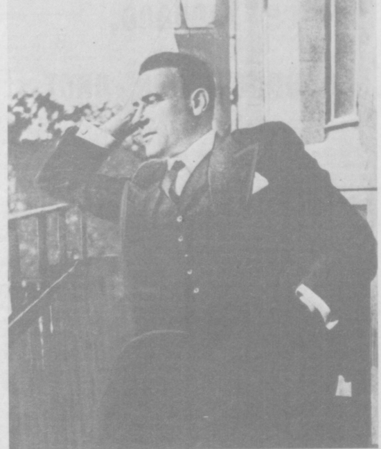
Сегодня—100 лет со дня рождения М. А. Булгакова

качеств семян подсолнуха, однако мы категорически против той формы обращения с ними, которая повышает вероятность инфицирования полости рта и ведет к антисанитарии города. С большим сожалением следует констатировать, что многие, даже на первый взгляд профессионально ориентированные люди, в частности речь идет о студентах-медиках, с которыми нам приходится контактировать, и ситаящие себя, безусловно, воспитанными, часто пренебрегают правилами поведения в общественных местах. Сидя на скамейках с друзьями, они заплывают окружающее пространство настолько, что создается довольно значительная и неприступная зона бескультурья. Итак, разговор наш затронул две на первый взгляд далекие друг от друга темы. Одна из них медицинская — как лучше сохранить зубы, другая касается проблем воспитания и поведения в обществе. На самом деле они тесно взаимосвязаны, взаимозависимы. Безусловно, ни у врачей, ни у студентов после опубликования статьи работы не станет меньше. Однако хотелось бы надеяться, что тащитцы, если и не все, то по крайней мере многие, наконец-то осознают важность соблюдения определенных правил поведения, а в результате город станет чище, уютнее, а здоровье крепче. А. ДАДАМОВ, кандидат медицинских наук. Э. МАХМУДОВ, профессор.