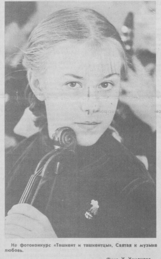
На фотоконкурс «Ташкент и ташкентцы». Святая к музыке любви.

да и хочу заметить, что качеством обслуживания эта фирма выгодно отличается от подобных ей. Здесь в полной мере действует негласный закон работников сервиса: заказчик всегда прав». Но что же все-таки предлагает «Сафар-Бехатар»? Путешествия по Средней Азии и Казахстану, знакомство со столицами городов, посещение музеев, участие в экскурсиях, совершение поездок на верблюдах по песчаным просторам пустыни. «Желание клиента — для нас закон». Это правило обязательно для каждого сотрудника фирмы. Несмотря на то, что фирма может проверить любой, стоит только обратиться в «Сафар-Бехатар».