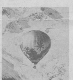
Ощутить захватывающее чувство высоты и полета на воздушном шаре... Вы можете испытать все это (в числе других досужих развлечений) в горах Швейцарии. Неискутому приятелю подобный опыт. По словам «воздухоплавателей», особенно когда совершенно удачно приземление...

В другой адрес. В грустной биографии этого пожилого человека добро, бескорыстные столкновения с расчетом и корыстолюбием. И если первое, умиротворяя душу, облегчает его страдания, то второе глубоко ранит, добавляя к физическим недугам еще и душевные. Дело в том, что после смерти в 1984 году жены, уже лишившись зрения, и с признаками другой подражавшейся коварной болезни, Н. познакомился с женщиной, тоже пожилой, матерью трех детей и бабушкой шести внуков. Назовем ее Г. Навио было бы утверждать, что брак в таком возрасте совершается по любви. На первом месте здесь, бесспорно, взаимное желание скрасить одиночество и старость друг друга. Но по тому, как развивались события дальше, в данном случае у Г. была иная цель: «сделать» квартиру своему сыну, т. е. передать ему свою трехкомнатную, а свой жилищный вопрос решить с помощью нового брака. Неплохо обстав-