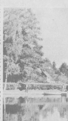
Туристы в парке

Близится лето, а с ним пора отпусков и трудноразрешимый вопрос — куда поехать? Особенно сейчас, когда проблема активного отдыха приобрела особую остроту, вобрав в себя все сложности экономического кризиса: возросшие цены, трудности с продовольствием и многое другое.