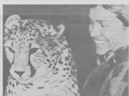
ШВЕЙЦАРИЯ. Не выдержав голода, после сурового снотания по горам вернулся домой молодой прескрипированный гелард по имени Паша. Его хозяйка Рагула Хьюбергер объяснила этот случай тем, что пища, которой она вскармливала зверя, оказалась вкуснее. Фото КЕЯСТОН—ТАСС.