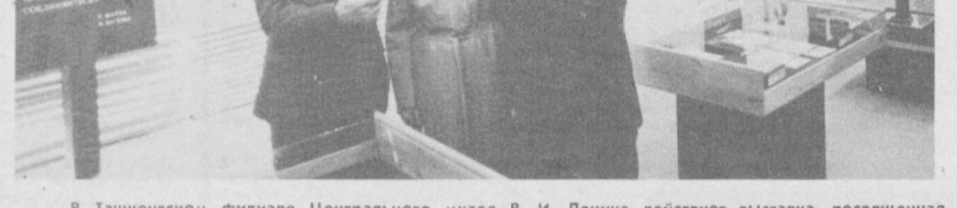
В Ташкентском филиале Центрального музея В. И. Ленина действует выставка, посвященная 165-летию со дня рождения и 100-летию со дня смерти Карла Маркса.

ОРДЖНИКИДЗЕ. Разработано крупное месторождение доломита начальной в предгорной части Кавказского хреб-