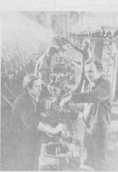
Вот так выглядят работники ташкентского производственного объединения искусственных и натуральных кож «Узбекистан».