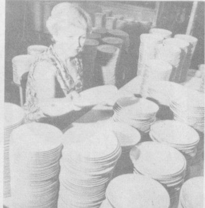
ЧССР. Чехословакия занимает сейчас одно из ведущих мест в мире по выпуску фарфоровых изделий, а число стран, покупающих эту продукцию, приближается к ста. Крупнейшим зарубежным покупателем чехословацкого фарфора является Со-