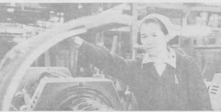
Сегодня на ее трудовом календаре — октябрь этого года.