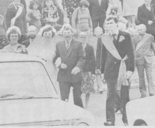
НА СНИМКЕ: свадьба — та, с которой берут начало все остальные свадьбы.

Медная свадьба отмечается после семи лет совместной жизни. И в этом названии свой смысл: мед — ценный, прочный материал, но до благородных металлов ей, конечно, далеко. Десятая годовщина семьи — розовая свадьба. Еще пять лет — стеклянная. Следующая — фарфоровая — венчает двадцатилетие совместной жизни. Тридцатая годовщина — жемчужная свадьба, сороковая — рубиновая. Золотая, как известно, празднуется после полвека совместной жизни. Но и на этом деле не кончается: есть еще платиновая (60 лет) и бриллиантовая (75 лет).