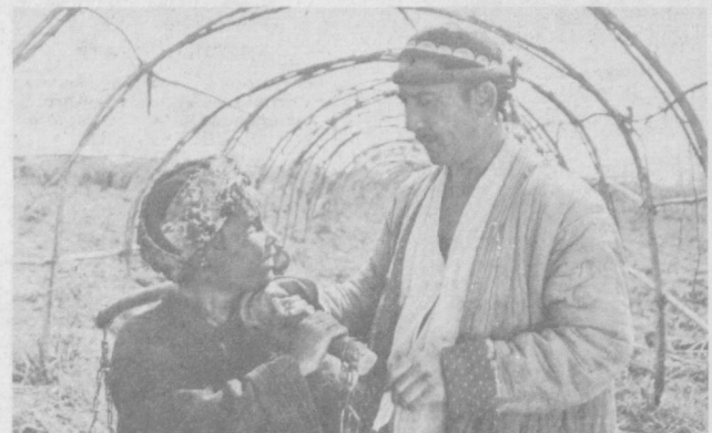
дние фильмов, кино-праздники, киновикторины.