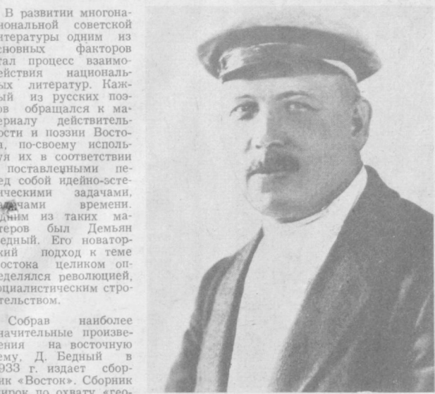
Именно им принадлежит основное количество переводов Д. Бедного, осуществленных в 20—30-е годы. Эти переводы часто включались в школьные хрестоматии и учебники по литературе.

Завтра общественность республики отмечает 100-летие со дня рождения великого пролетарского поэта Демьяна Бедного. В Доме литераторов имени Хамиды Алимджана состоится юбилейный вечер, посвященный знаменательной дате.