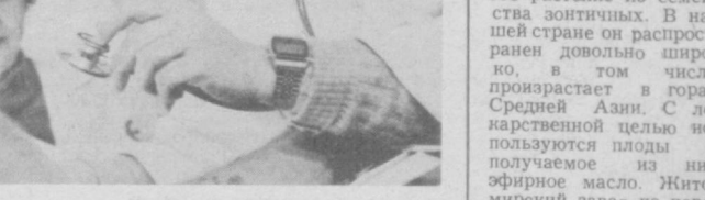
В плане социального развития предприятия предусмотрено дальнейшее расширение медсанчасти, совершенствование медицинского обслуживания завод-

Проявляя постоянную заботу об улучшении медицинского обслуживания, здесь большое внимание уделяют тому, чтобы каждый заводчанин тратил минимум времени при обращении в поликлинику. Здесь регулярно проводятся профилактические осмотры рабочих и служащих, и, если обнаружены первые признаки того или иного заболевания, выписывается направление на стационарное или амбулаторное лечение. Ведется особый учет инвалидов, участников Великой Отечественной войны и ветеранов труда.