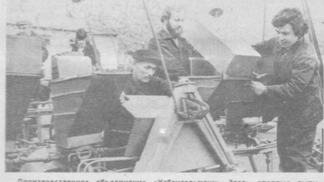
Производственное объединение «Узбексельмаш». Здесь впервые выпущена опытно-промышленная партия универсальных тракторных селенок типа «СУ-4». Новая техника в недалеком будущем примет участие в весенне-полевых работах не только в ряде областей Узбекистана, но и Туркменики и Таджикистана. Агрегат благодаря электронной системе сцепления высева семян хлопчатника в почву действует без сельхозмеханизатора. НА СНИМКЕ: на участие в сборке универсальных хлопковых селенок.

Именно такие стеклянные нити служат проводником для луча света, «нагруженного» информацией. Они могут быть длиной в несколько десятков километров, их можно особым способом соединить между собой. Но, конечно, для изготовления этих световодов применяется не только чистое стекло; возможная доля примесей в нем выражается числом, которое трудно представить — 0,00000001!