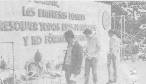
Более 500 наименований изделий были представлены в Гаване на выставке продукции местной промышленности (на снимке). В экспозицию вошли мебель, одежда, обувь, ткани, хозяйственные товары, игрушки, сувениры.

БУДАПЕШТ. Двухмиллионную тонну угля с начала года выдала на-гора шахтеры угольного разреза им. Морица Тореза в Вишенте. Их ударный труд станет залогом бесперебойной работы теплоэлектростанции им. Юрия Гагарина, расположенной по соседству.