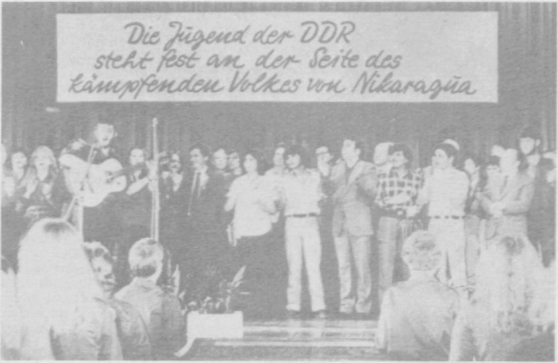
ГДР. «Руки прочь от Никарагуа!» — под таким лозунгом на Берлинском заводе телевизионной аппаратуры состоялся митинг солидарности с борьбой никарагуанского народа против вооруженной интервенции контрреволюции, поддерживаемой Вашингтоном (на снимке).

Магальян не нашел нужным создать хотя бы видимость независимости собственного режима от Вашингтона и прямо заявил, что «без американской помощи у нас бы появились серьезные проблемы».