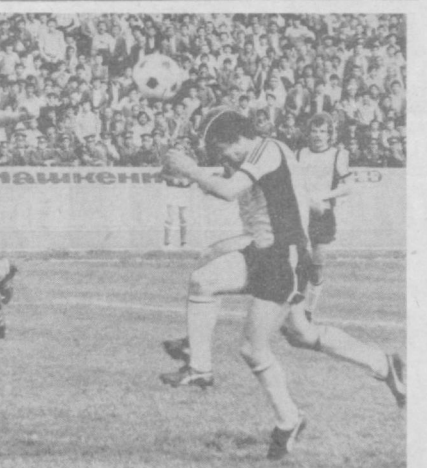
17 мнений о «Пахтагоре»