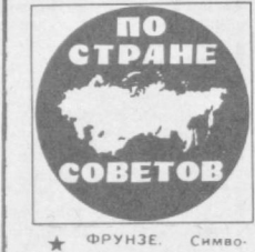
★ ФРУНЗЕ. Символический ключ от нового автозавода получил депутат Кочкорского сельсовета на Центральном Тянь-Шане. По их наказам вместо старого дома здесь возведено современное здание. К услугам пассажиров — просторные залы, комната отдыха, санузлы, станция обслуживания, улучшены сотни километров горных дорог.