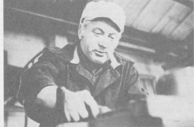
гусей в личных хозяйствах сельских жителей Латвии помогают работникам Резекненской птицефабрики. Они открыли в нескольких населенных пунктах магазины, где можно купить молодую птицу. Ежедневно в них намечено продавать населению до двух тысяч гусей.

перевозок осуществлялся с помощью автомобилей, депутаты уделают большое внимание развитию автотранспорта. За последние годы по их наказам построены десятки автовокзалов, станций таксообслуживания, улучшены сотни километров горных дорог.