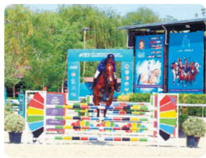
От спорти: БЕКЗОД ҚУРБОНОВ жаҳон кубогида учта олтин медалга эга чикди.