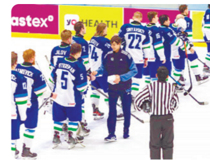
Ўзбекистон терма жамоаси ХОККЕЙ БЎЙИЧА катталар ўртасидаги жаҳон чемпионатининг IV дивизион беллашувларида ғолиб бўлди.