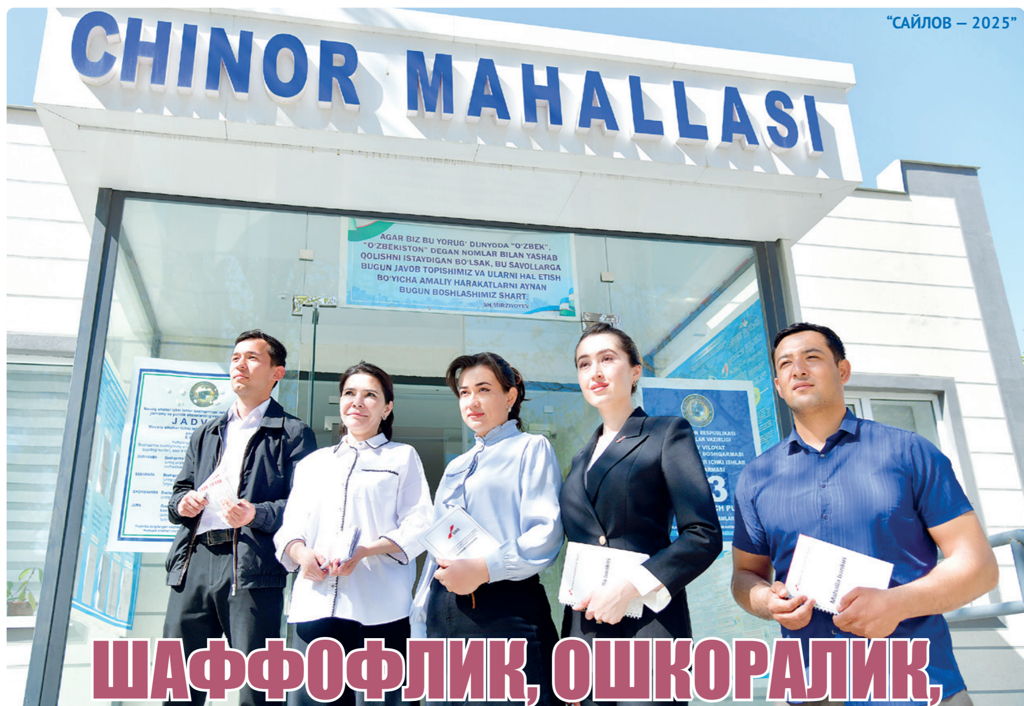
“САЙЛОВ – 2025”