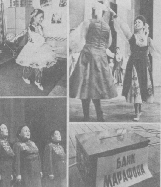
Марафон во дворце Во Дворце культуры и техники авиационников состоялся марафон «Культура и жизнь», в котором приняли участие десятки творческих коллективов. Средства, поступившие в его фонд, пойдут на развитие культуры в нашем городе.