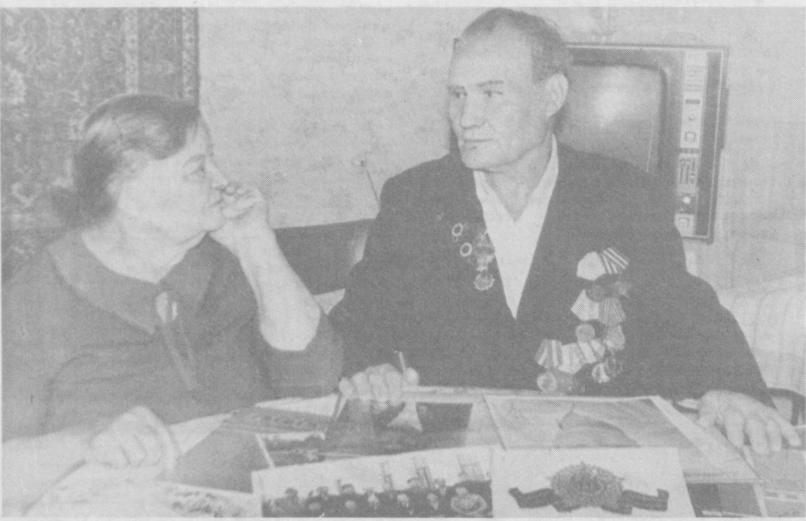
Штрихи к портрету ветерана