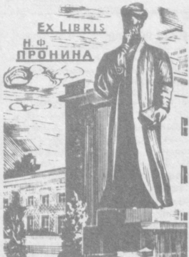
коллаж Федоровича Пронина, сделанный для него художником Козловым.

Э. СЕРГЕЕВА. НА СНИМКЕ: книжный знак из коллекции книголюб Навои.