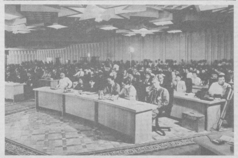
Во время открытия «Ташкентской деловой встречи».