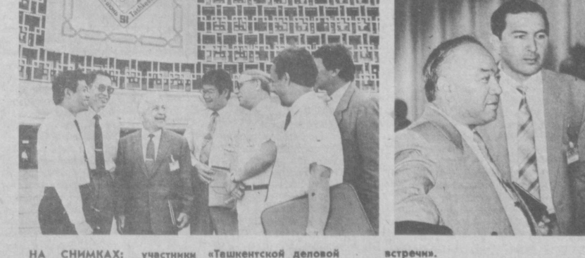
НА СНИМКАХ: участники «Ташкентской деловой встречи».