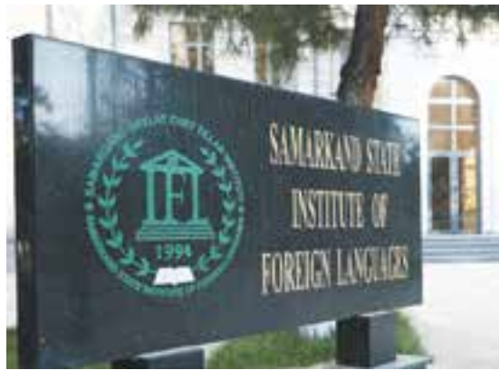
Konferensiyada "Badiiy matnning stilistik tahlili", "Chet tillarni o'qitishda axborot texnologiyalari, masofaviy ta'lim

Zamonaviy tilshunoslikda xorijiy tillarni o'rganish va o'qitish bugungi kunda avvalgi vaqt mezoni bilan taqqoslanganda biroz oson, turli texnik, texnologik, metodik imkoniyatlar yuqori darajada shakllangan. Shuning uchun ham Samarqand davlat chet tillar instituti ingliz tili nazariyasi hamda ingliz tili nazariya aspektlari kafedralari jamoasi tashabbusi bilan joriy yil 25-aprel kuni "Chet tillarni o'qitishning dolzarb masalalari: muammolar, yechimlar, an'ana va innovatsiyalar" mavzusida xalqaro ilmiy-amaliy anjuman o'tkazilishi rejalashtirilmoqda.