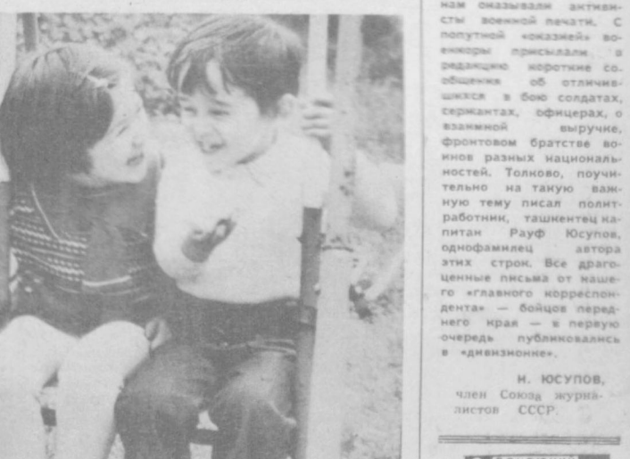
ХОРОШЕЕ НАСТРОЕНИЕ.

— Фирдин Саттарович! Из всех существующих профессий одна из сложнейших — режиссура. Скажите, что главное в профессии оперного режиссера.