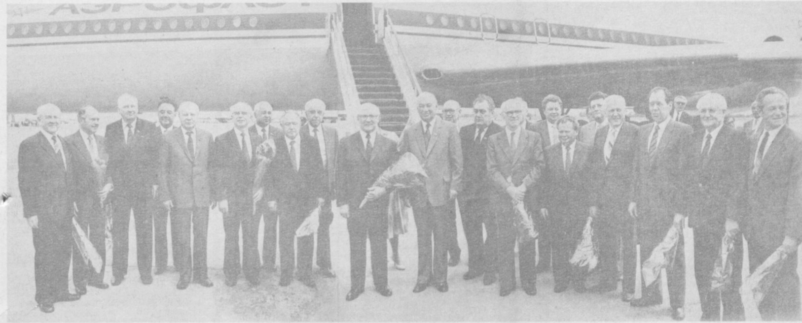
Ташкент, 6 мая 1983 года. Встреча в аэропорту.