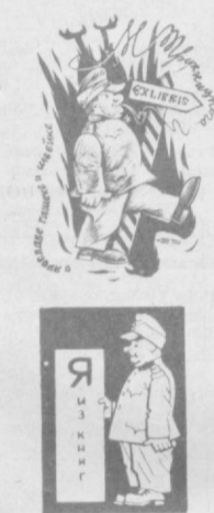
Я. Я. Трубецкого

Нередко можно встретить на книжных знаках любимых литературных героев, особенно в тех случаях, когда книга собрана на одном конкретном писателе.