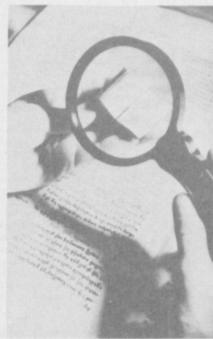
НА СНИМКЕ: в отделе редких книг.

Семь миллионов томов общественно-политической, художественной, учебной, специальной, научно-популярной литературы хранятся в фондах крупнейшего книгохранилища Грузии — Государственной республиканской библиотеки имени Карла Маркса в Тбилиси.